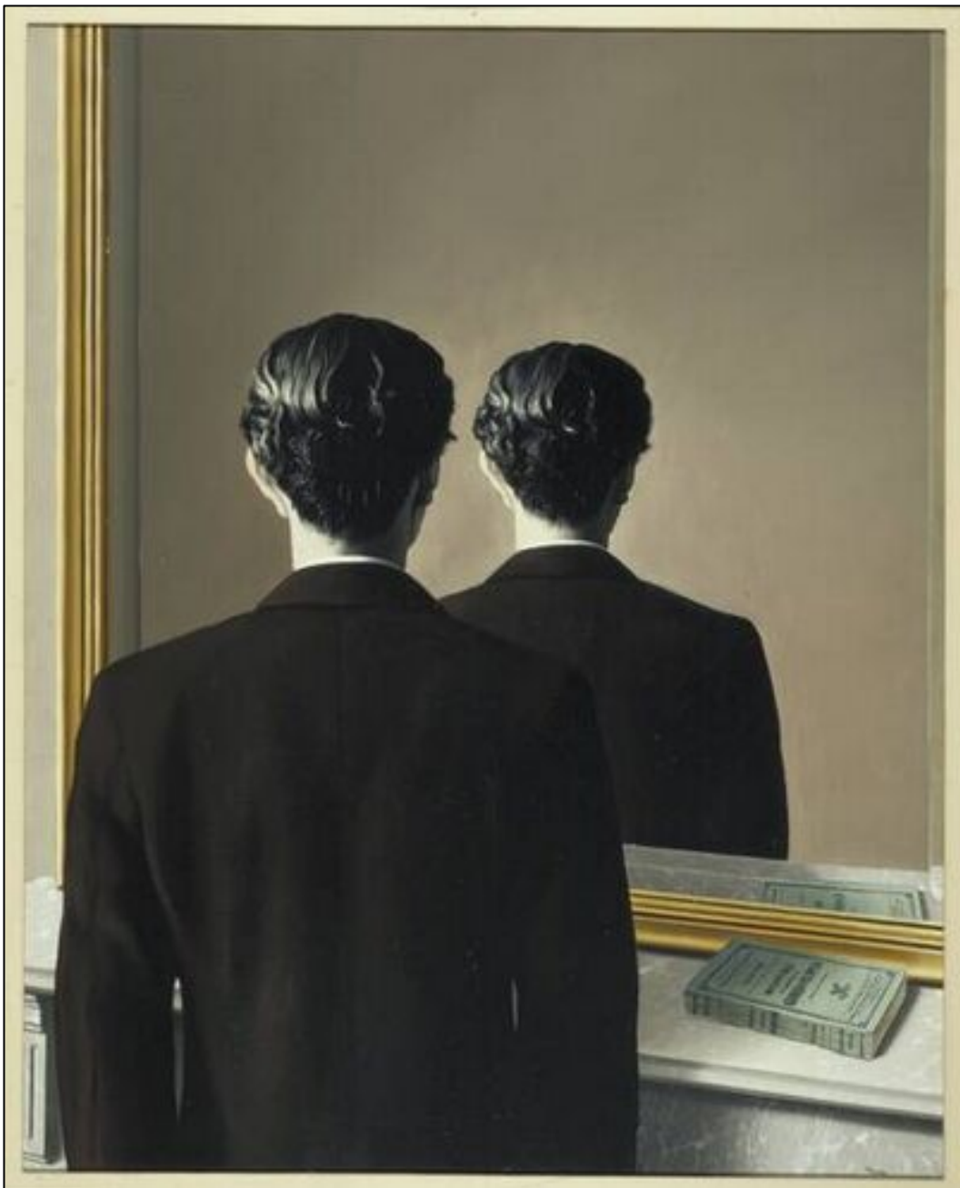
Figuur 4: Verboden af te beelden (Museum van Boimans Beuningen 2013)

Die kreatiewe proses van die ontwikkeling van die foto-collage is geïnisieer en gevoed deur die voorblad van Beeltenis verbode (Aucamp 1998), na die skildery Verboden af te beelden (1937) – sien Figuur 4 – van Magritte (Aucamp 1998:4). Volgens Aucamp (1998:4) het Magritte die skildery van sy beskermheer Edward James (1907–1984) geskilder toe hy in Londen by James geloseer het. Die skildery toon nie James se gesig nie, slegs die titel van die boek wat op die marmerkaggelrak lê. Die boek is die Franse weergawe van Edgar Allen Poe – 'n skrywer bekend vir die makabere en die misterieuse –se enigste roman.