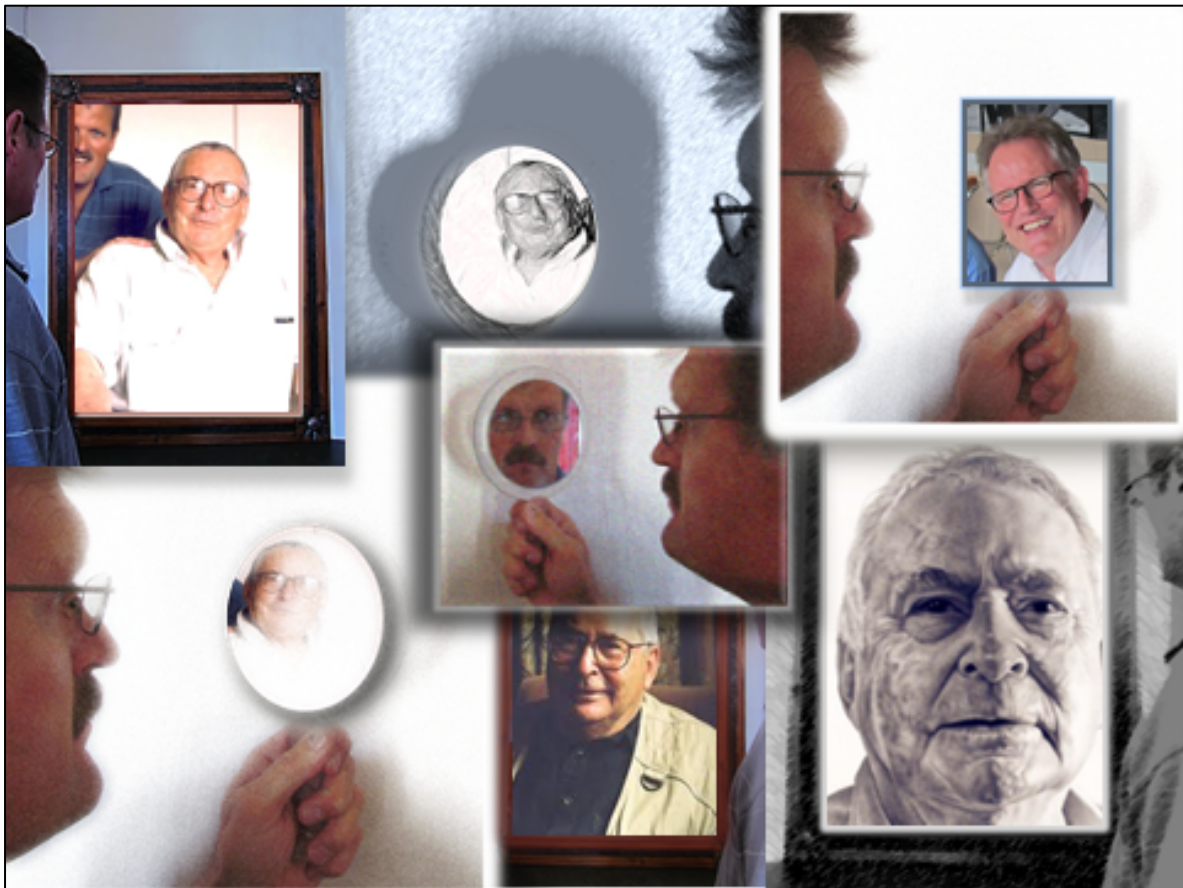
Figuur 3: ’n Foto-collage ter uitbeelding van die navorsingsproses (sien bespreking in teks)